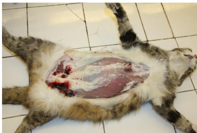
Рисунок 6. Вскрытие трупа кошки

Органы ротовой полости, шеи, грудной, брюшной и тазовой полостей извлекают единым комплексом с сохранением анатомических связей между ними (по методу Г. В. Шора) или в необходимых случаях (в частности, при вскрытии крупных животных) с частичным расчленением органокомплексов с учетом анатомо–физиологических и системных связей.