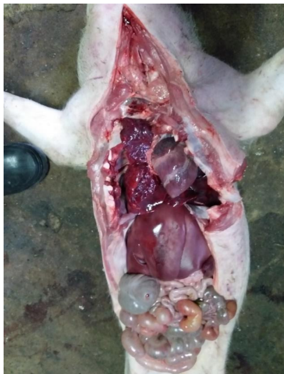
Рисунок 5. Вскрытие трупа поросенка

Брюшную полость вскрывают одним продольным разрезом, который идет от мечевидного хряща до лонного сращения, и двумя поперечными разрезами от мечевидного хряща до первых поясничных позвонков по реберным дугам.