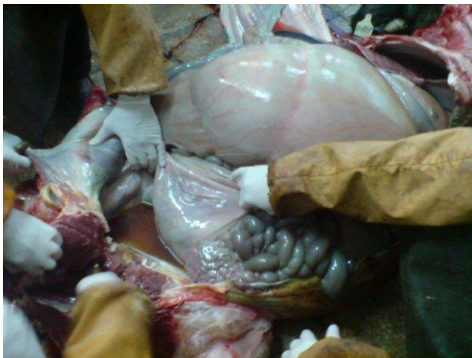
Рисунок 3. Вскрытие трупа коровы

и конечную петлю ободочной кишки, прямую кишку, определяют количество и свойства содержимого, состояние кишечной стенки, слизистой оболочки и солитарных фолликулов. При обнаружении гельминтов проводят копрологические исследования. При наличии соответствующих показаний (инфекционные заболевания, отравления) берут патологический материал и содержимое для дополнительных лабораторных исследований.