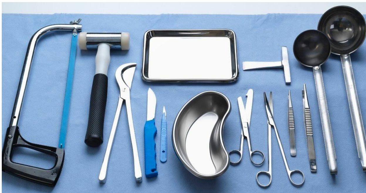
Рисунок 2. Инструменты, применяемые для вскрытия трупов животных

Для вскрытия трупов животных необходимо иметь анатомический набор инструментов (рис. 1). Он предназначен для вскрытия трупа любого животного.