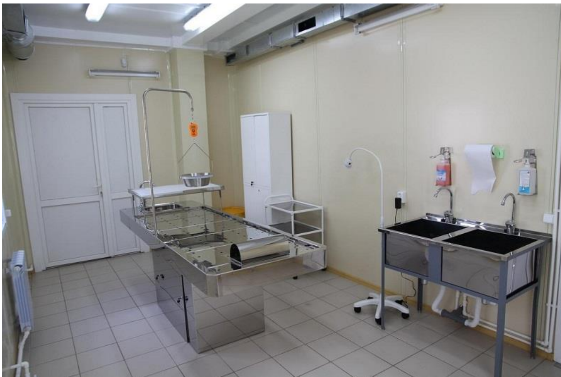
Рисунок 1. Секционный зал

ментарием для исследования внутренних органов и вскрытия трупов мелких животных.