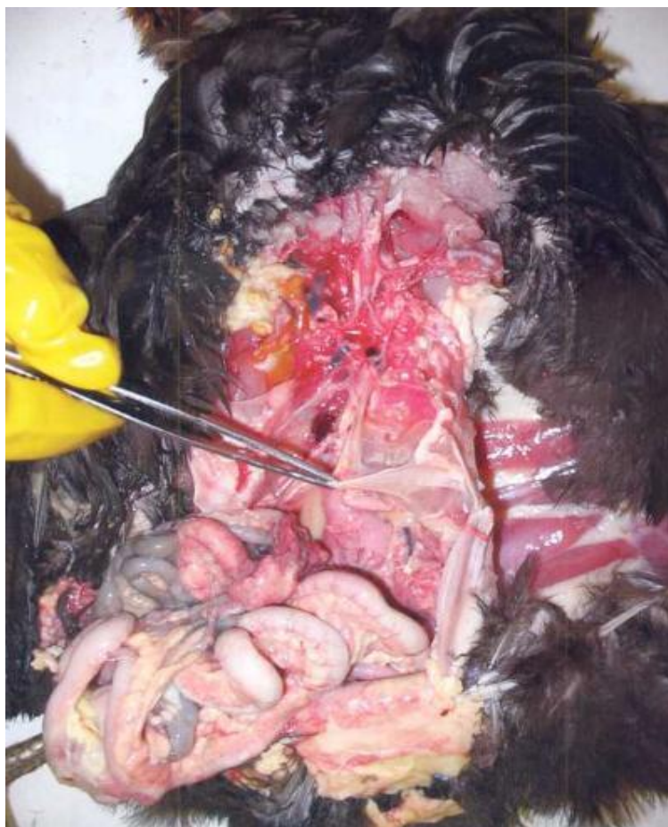
Рисунок 8. Вскрытие трупа птицы

При необходимости исследуют спинной мозг. Спинномозговой канал вскрывают следующим образом: очищают позвоночный столб от мягких тканей и удаляют костными ножницами все костные отростки так, чтобы вентральная и дорсальная поверхности были по возможности ровными. Затем эти поверхности распиливают тонкой пилой по средней линии. Вскрывать спинномозговой канал можно также перекусыванием костными щипцами или ножницами дужек позвонков, предварительно расчленив спинномозговой канал на три части: шейную, грудную, пояснично-крестцовую.