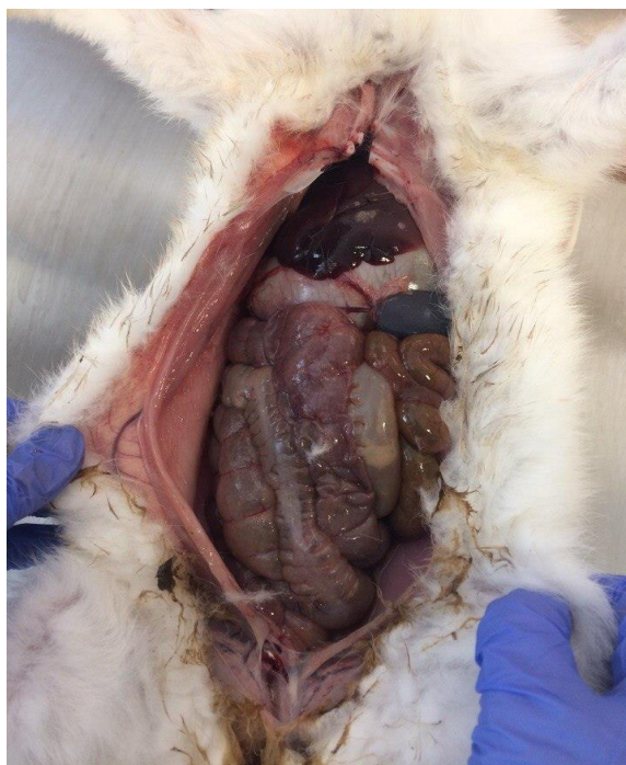
Рисунок 7. Вскрытие трупа кролика

Обращают внимание на заболевания, которые часто встречаются у кроликов (вирусный ринит, эймериоз, миксоматоз, спирохетоз, токсоплазмоз, пастереллез, стафилококкоз, некробактериоз, тимпаний, коринобактериоз, туляремия, пневмония, гастроэнтериты, алиментарная дистрофия в др.).