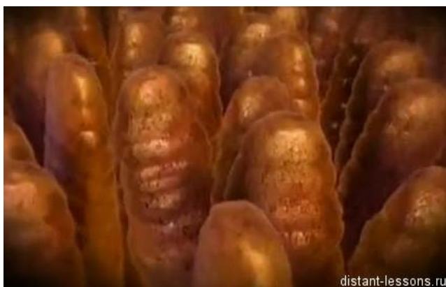
Рис.3 - Ворсинки кишечника

Всасыванию способствуют также сокращения ворсинок. В стенках ворсинок находятся гладкие мышцы, которые, сокращаясь, выдавливают содержимое лимфатического капилляра в более крупный лимфатический сосуд. Движения ворсинок вызываются продуктами распада пищевых веществ - желчными кислотами, глюкозой, пептонами, некоторыми аминокислотами.