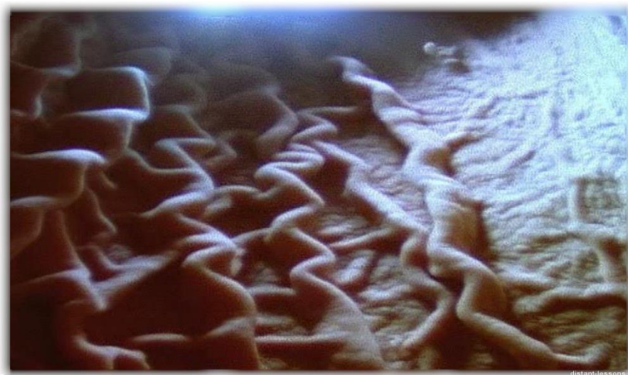
Рис.2 - Стенки желудка человека изнутри — огромное количество складок

пищевая масса превращается в жидкую кашу ( химус ). В состав желудочного сока входят ферменты, соляная кислота и слизь.