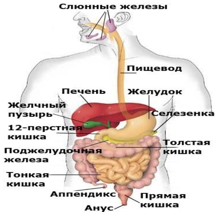
Рис. 1. Пищеварительная система человека