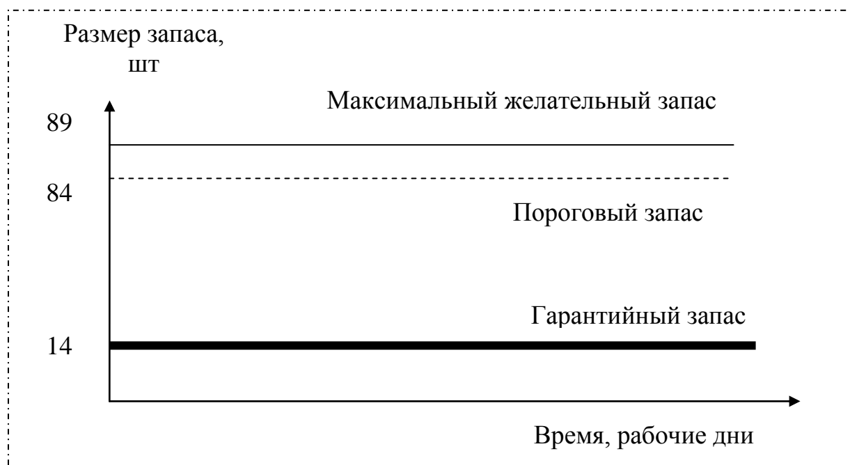
Рис. 1. Построение графика движения запасов в системе с фиксированным размером заказа

Движение запасов в системе с фиксированным размером заказа можно графически представить в следующем виде (рис. 1).