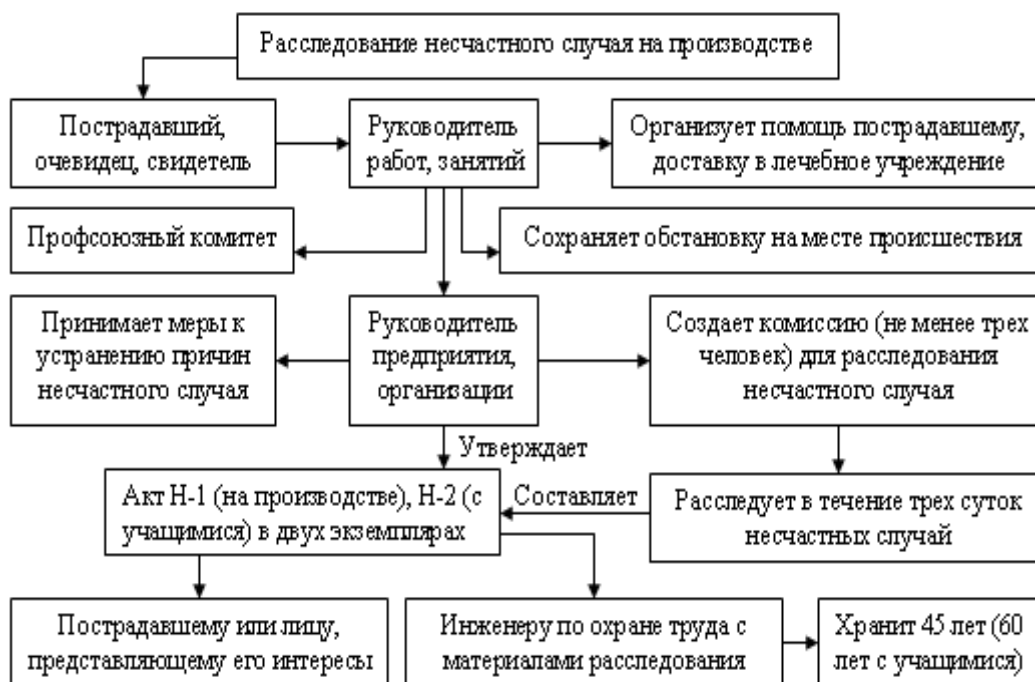
Рисунок 1 - Распределение обязанностей при несчастном случае

5.11 Председатель комиссии по расследованию несчастного случая должен письменно уведомить пострадавшего (в случае смерти пострадавшего — его родственников) о том, что в расследовании несчастного случая может принимать участие его (их) доверенное лицо.