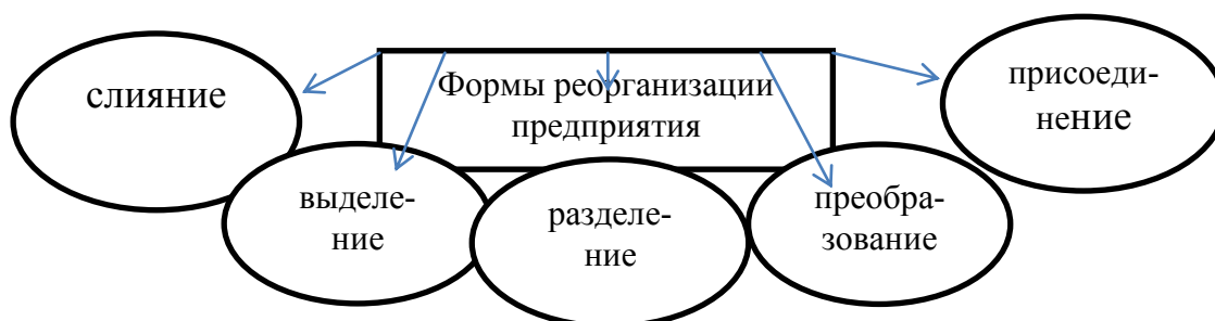
Рис. 3. Основные формы реорганизации предприятий

Задание 9.1. Изучите формы реорганизации предприятий, предусмотренные российским законодательством (рисунок 3) и рассмотрите их особенности с позиций финансового менеджмента. Письменно охарактеризуйте суть каждой формы реорганизации.