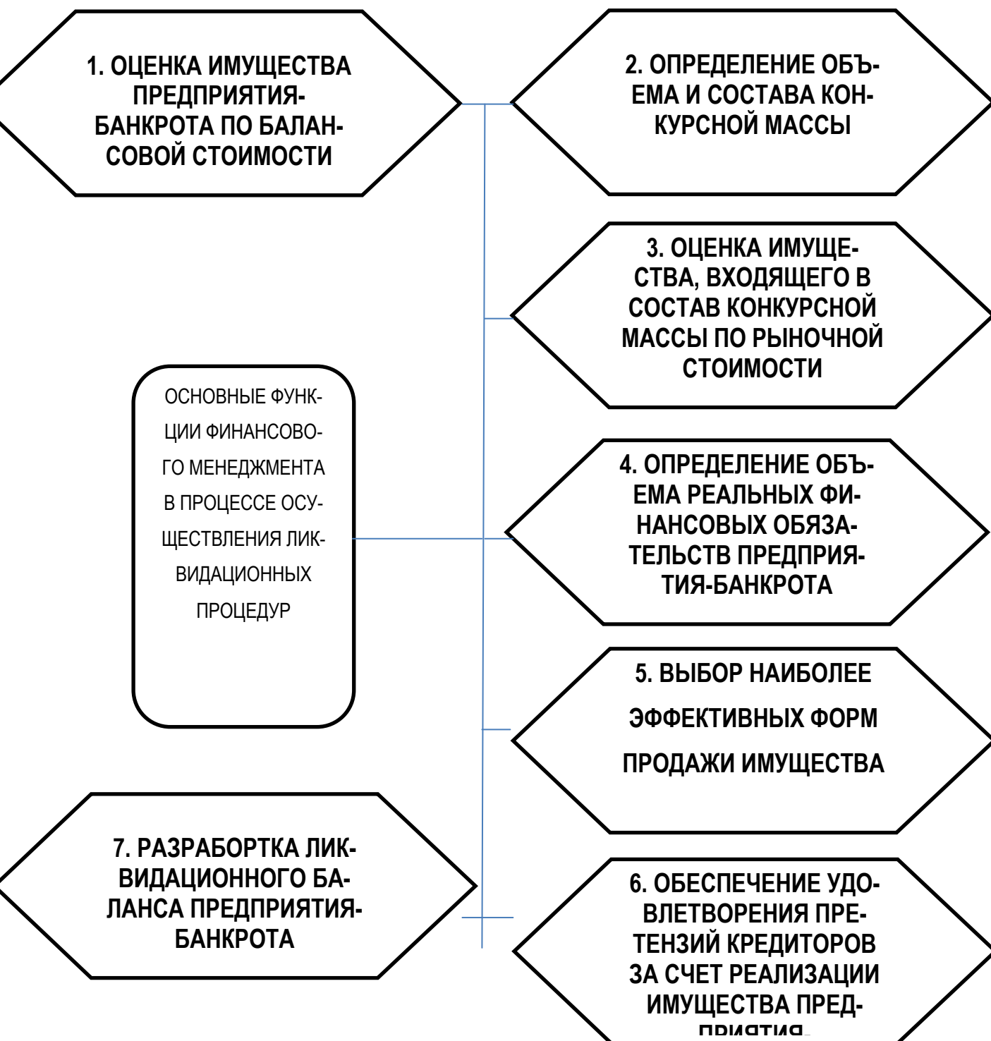
Рис. 4. Состав основных функций финансового менеджмента в процессе осуществления ликвидационных процедур при банкротстве

Задание 9.3. Предложите мероприятия по выводу малого предприятия из кризиса.