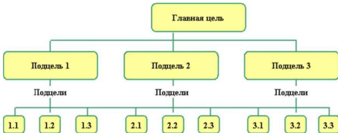
Рис. 1. Пример построения «дерева целей»

Необходимо для реализации этих стратегических целей сформировать «дерево целей» по трем направлениям: изменить производственную систему, изменить систему маркетинга, реализовать конкурентные преимущества предприятия (рис. 1).