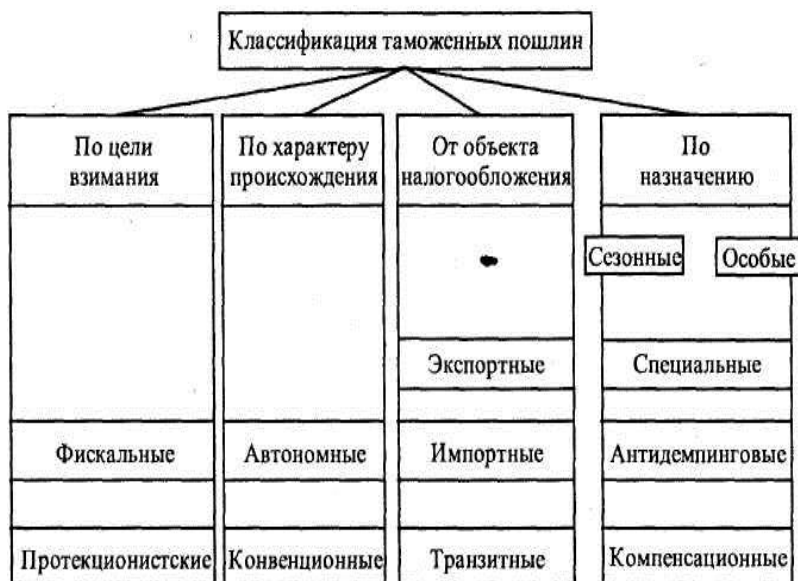
Рис. 2. - Классификация таможенных пошлин