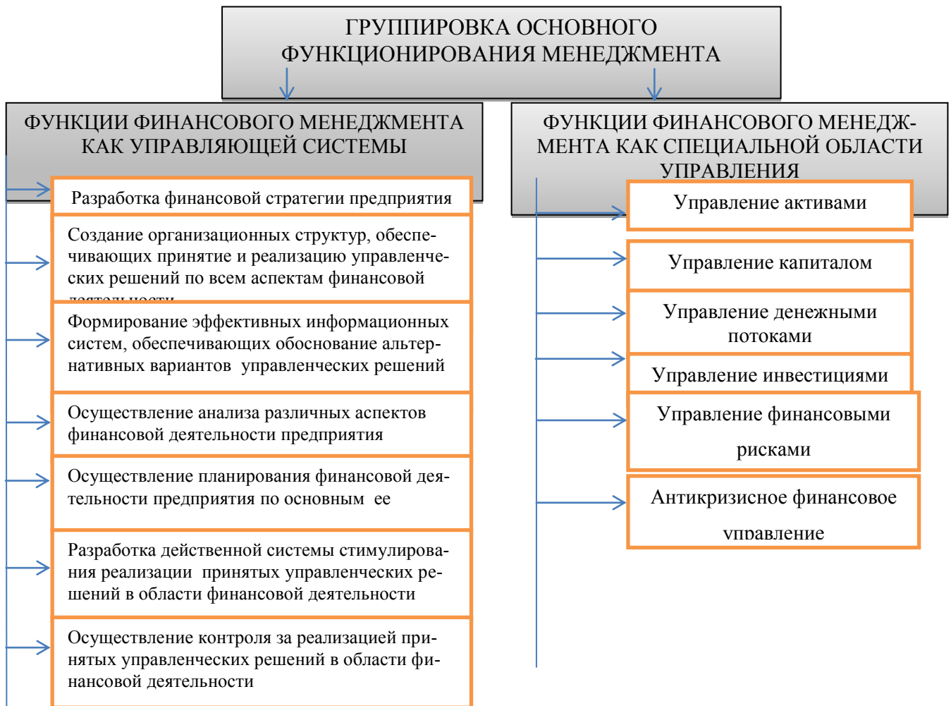
Рис. 1. Характеристика основных функций финансового менеджмента в разрезе отдельных групп