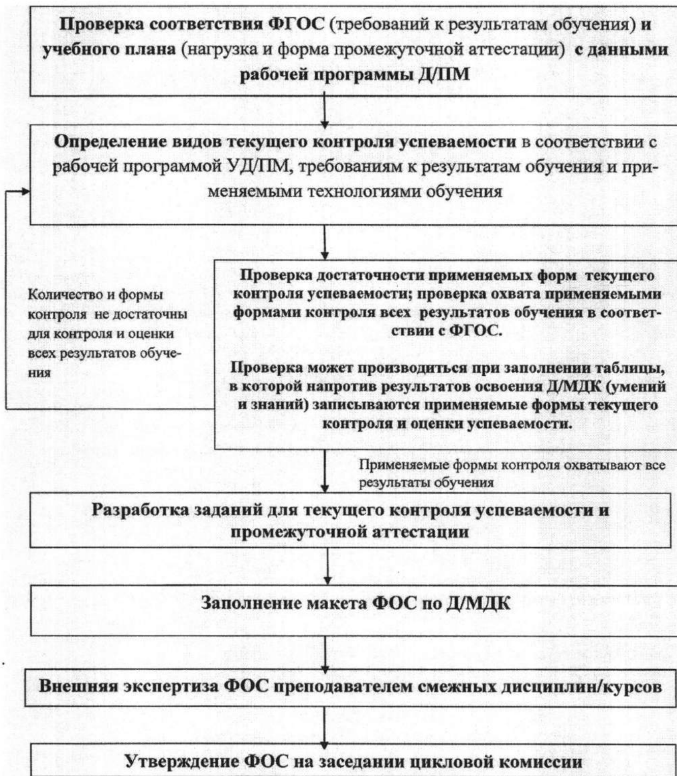
Рисунок 1 - Алгоритм разработки ФОС по Д/МДК

Спецификации и задания для контрольных или проверочных работ, для промежуточной аттестации прикладываются к паспорту ФОС.