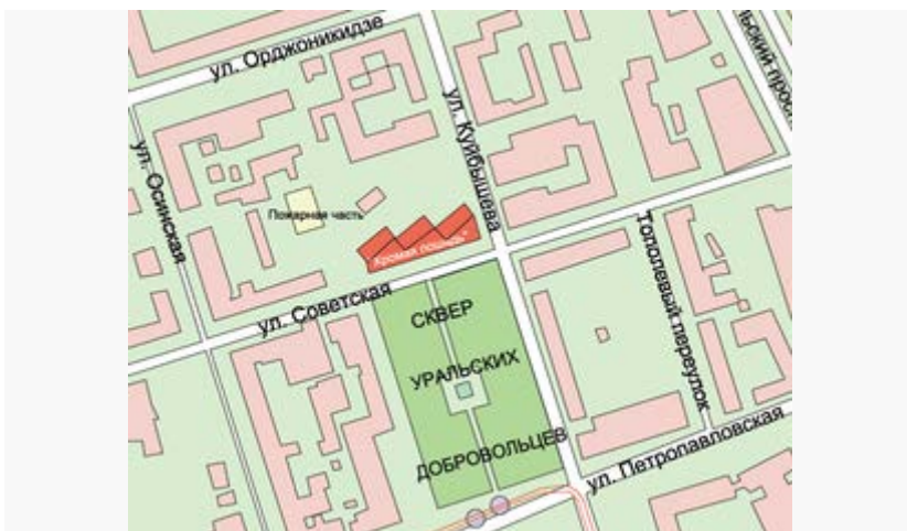
Рисунок 5 - Схема расположения ночного клуба «Хромая лошадь» на карте Перми

По заключению следствия жертвы пожара погибли преимущественно из-за отравления угарным газом и продуктами горения.