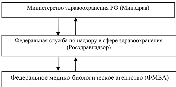
Рисунок 1 - Коммуникационные связи между органами здравоохранения

Под стрелкой вниз – приказы, распоряжения, под стрелочкой вверх подразумеваются отчеты и доклады