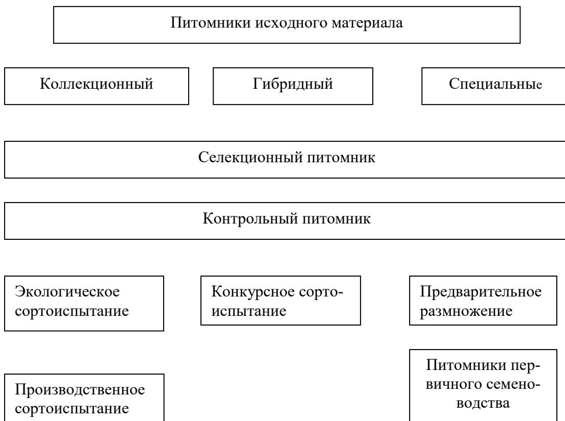
Рис. 3. Схема селекционной работы с самоопыляющимися культурами

обычно проводят непосредственно в поле, выбирая из посева лучшие растения по комплексу тех признаков, которыми должен обладать будущий сорт. Все отобранные растения дополнительно просматривают в лаборатории для установления типичности, отсутствия заболеваний, выполненности зерна и т.д. Урожай всей массы растений, оставшихся после браковки, объединяют и высевают на следующий год на одном участке.