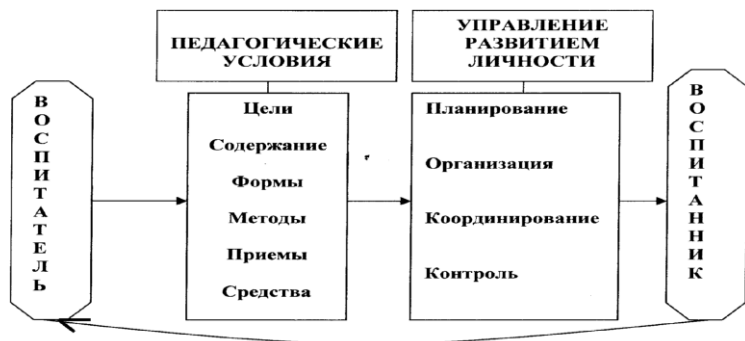
Рис. 2. Воспитание – это управление развитием личности

Сегодняшний подход к пониманию процесса воспитания расширяет взгляд: процесс воспитания протекает в рамках педагогической системы, воспитательная работа носит характер управления , регулирования процесса, т.е. имеется отслеживание его состояния, принятие решений, оказание воздействия, проверка и корректировка результатов — все то, что характеризует систему управления.