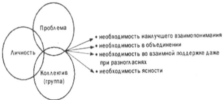
Рис. 2. Система отношений в группе

Интересы группы в целом связаны со стремлением к тесным взаимоотношениям между собой для достижения сплоченности, которая необходима в эффективной работе.