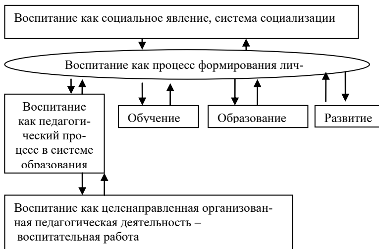
Рис. 1. Воспитание как родовое понятие

В рамках нашего курса, и в этом мы разделяем точку зрения Б.Т.Лихачева, воспитание будет пониматься как основополагающая, исходная категория педагогической науки, которая включает другие основные категории педагогики: образование, обучение, педагогическую деятельность и т.д. Схематически это можно представить следующим образом (рис. 1, с.59.):