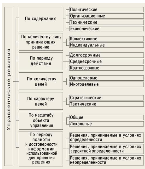
Рис.1. Классификация управленческих решений